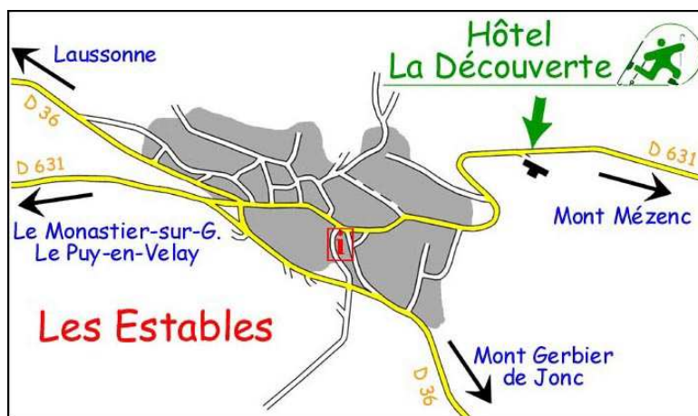
Accès à l'hôtel

300 m après la sortie du village, après 2 grands virages, l'hôtel se trouve à droite.